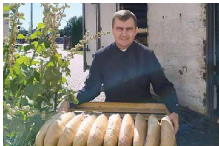
Sandwich für 30 Rp.