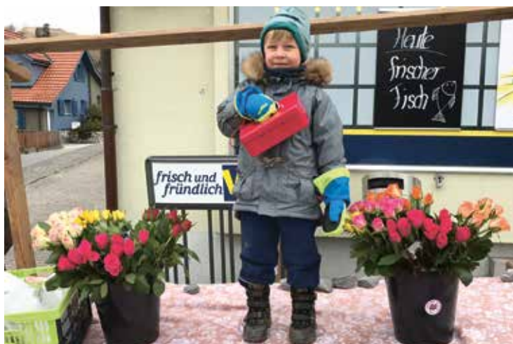
Erinnerung an den traditionellen Rosenverkauf