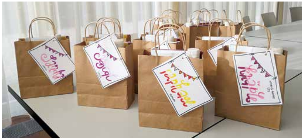
Kleine Zeichen stärken die Verbundenheit.

Pfarrsekretariat | s. Pfarramt Gams | 081 771 11 44 | Öffnungszeiten: Mo–Fr 08:30–11:30 www.kathsennwald.ch